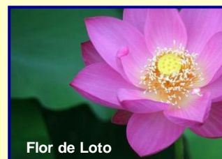
Flor de Loto

El Nilo es el río sagrado de Egipto. Se le consideraba “la fuente de la descendencia”, pues contenía las aguas de la vida. Separaba el este del oeste y para los egipcios era la representación de la Vía Láctea. En sus orillas crece la flor del loto, que es su símbolo sagrado.