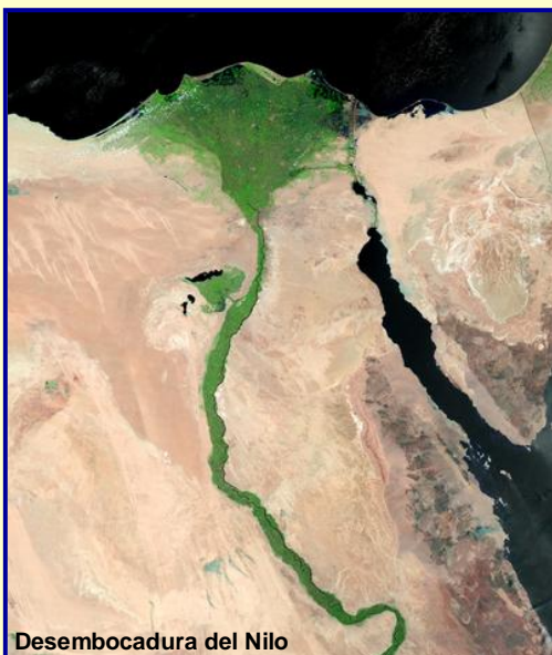
Desembocadura del Nilo

consideran purificadoras. Desde hace siglos los creyentes llegan por millones hasta él para sumergirse en sus aguas y liberarse así de sus pecados, pues creen que “morir en sus orillas conduce a la salvación.” Para Tulsidas 10 , filósofo y poeta místico hindú, el río Ganges es “el dador de salvación y disfrute material”. Los creyentes manifiestan que beber sus aguas es “como ser amamantado por la propia madre”. Todo esto, a pesar de que un profano pensaría en el elevado grado de deterioro de calidad que tienen sus aguas, pues el Ganges es uno de los diez ríos más contaminados del mundo.