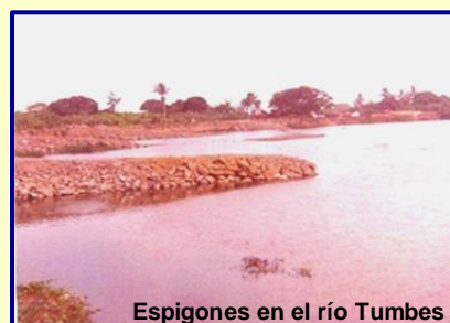
Espigones en el río Tumbes

En el Perú tenemos numerosos ríos cuyos caudales se encuentran muy irregularmente distribuidos en el tiempo y en el espacio; sin embargo, su aprovechamiento resulta ser fundamental para lograr la supervivencia.